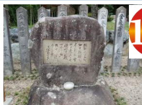
高杉晋作遊撃隊激励の詩の石碑