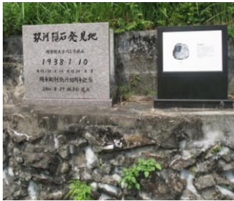
玖珂隕石発見地(周東町川上)

隕石とは、地球外から来て地球と衝突し、地表に落下した天体のことをいいます。岩石を主な成分とする 石質隕石 、鉄とニッケルの合金からなる 鉄隕石 、岩石と鉄とニッケル合金が混じった 石鉄隕石 の3種類に大きく分けられます。 玖珂隕石 には、鉄隕石特有のモザイク状の結晶模様「 ウイドマンシュテッテン構造 」が見られます。 参考文献『隕石の見かた・調べかたがわかる本』藤井旭